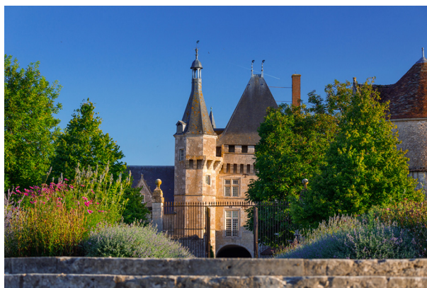
Le château de TalcY vu depuis le jardin

En voiture, depuis Tours ou Orléans, A10, sortie 17 vers Blois, puis D956 vers Contres et D52