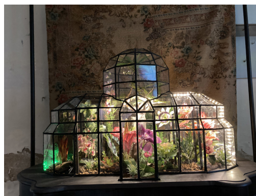
Jardin miniature - Benoît