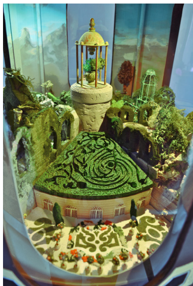
Carrousel (détail) - Piet.sO et Peter Keene