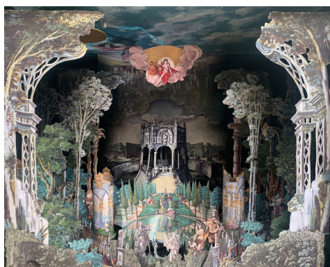
Jardin baroque - Sébastien Simon