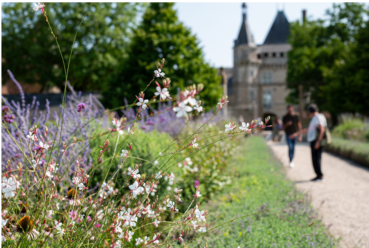
Le château de Talcy vu depuis le jardin

Depuis 2008, plus aucun produit chimique n'est utilisé dans l'ensemble des jardins de Talcy. Du sable, du compost, un peu de fumier... et le tour est joué ! Quant à l'entretien des sols, il est confié à une ânesse et à quelques brebis solognotes, qui assurent un écopâturage paisible. Les jardins du château de Talcy sont un paradis bucolique pour les amateurs d'Histoire et de demeures pittoresques.